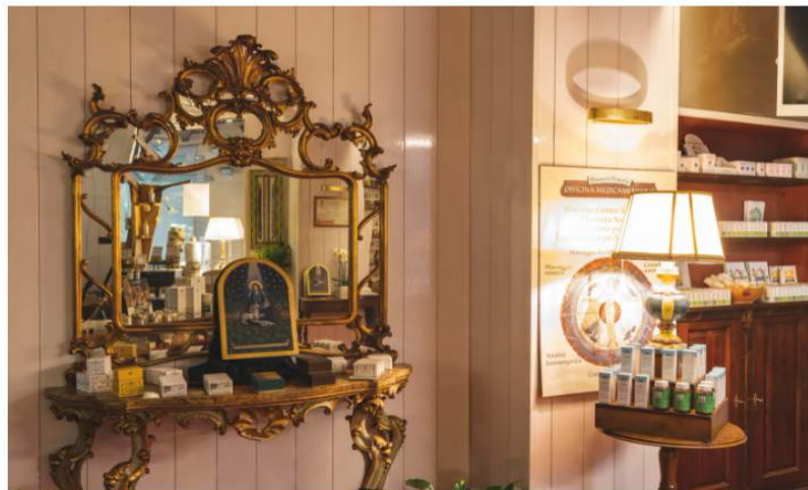
L'Atelier del BenEssere di Thesaura Naturae

Passeggiando nel centro di Stresa (in via Cavour, 8), vi imbatterete in un posto fuori dal tempo in cui lasciarsi andare per perdersi e poi ritrovarsi. È l' Atelier del BenEssere di Thesaura Naturae . Qui passato e presente si sposano armonicamente a conferma che « non vi è fine ed interruzione », come diceva Hdegarda di Bingen , nella perfetta trasformazione del Creato e che la bellezza risiede proprio nell' unione del Tutto . Curato fino al minimo dettaglio, dall'arredo alla musica, dai libri al profumo, qui è possibile allontanarsi dalla frenesia del quotidiano e ritrovare il proprio ritmo interiore attraverso la ricerca dell'armonia, che passa attraverso la conquista di più spazio d'ascolto per sé.