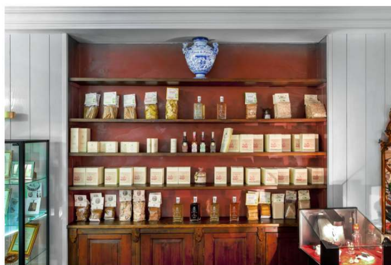
L'Atelier del BenEssere di Thesaura Naturae

Ogni trattamento è un'esperienza individuale e calibrata sulle esigenze di chi lo andrà a ricevere. È il frutto di conoscenze, comprensive di approcci tecnici diversi ma coerenti e complementari, in grado di cogliere la persona nella sua interezza di mente, corpo e spirito , ma anche secondo una visione più propriamente energetica , ildegardiana, aiutandola in un percorso di consapevolezza attraverso unguenti, pietre e rituali. Tutti "rimedi" da comprare, naturalmente, in negozio.